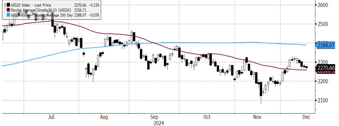
WIG20 Index (WIG20) graph 1550 Daily 17JUN2024-17DEC2024