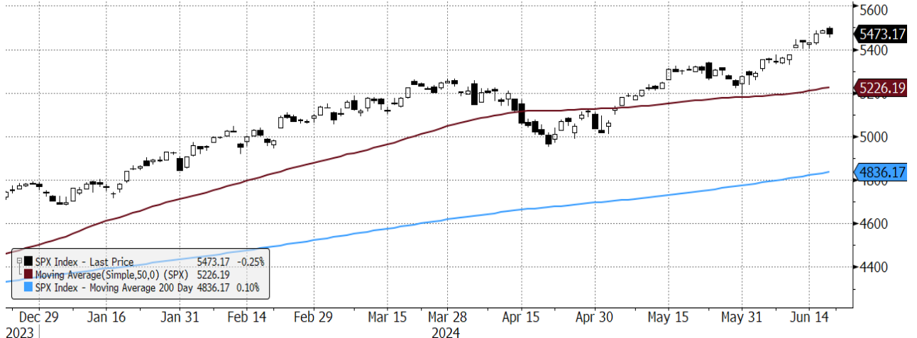
SPX Index (S&P 500 INDEX) G1598 Daily 21DEC2023-21JUN2024