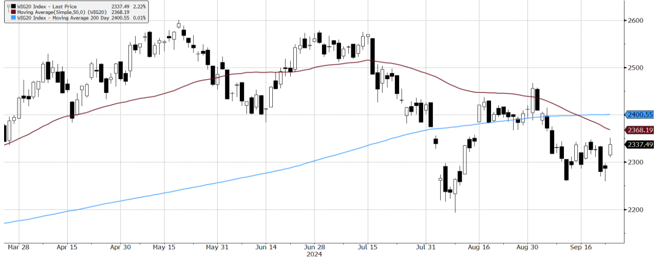
WIG20 Index (WIG20) graph 1550 Daily 25MAR2024-25SEP2024