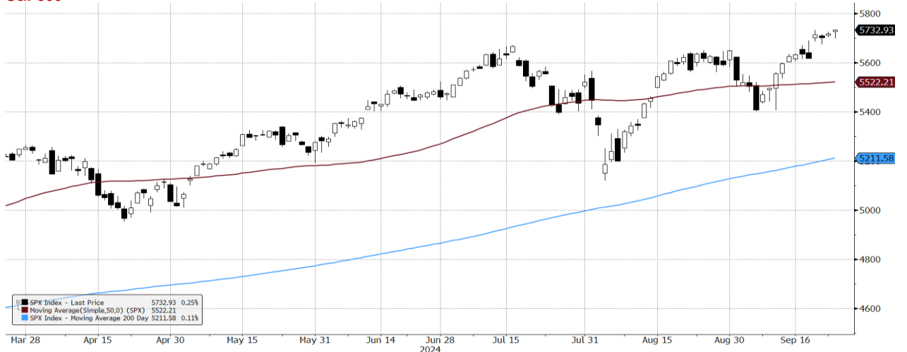
SPX Index (S&P 500 INDEX) G1598 Daily 25MAR2024-25SEP2024