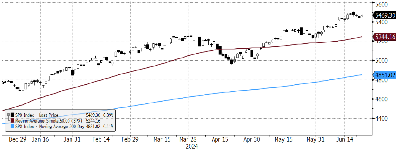
SPX Index (S&P 500 INDEX) G1598 Daily 26DEC2023-26JUN2024