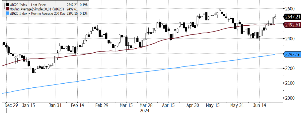
WIG20 Index (WIG20) graph 1550 Daily 26DEC2023-26JUN2024